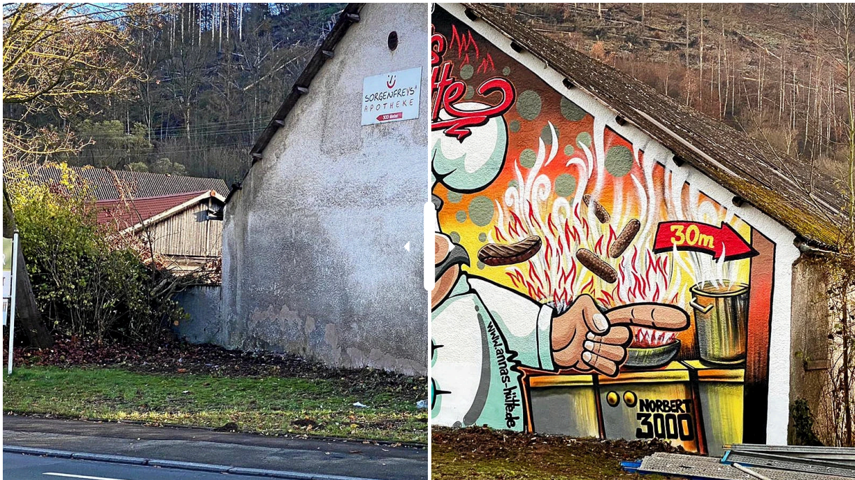
Anna's Hütte Bredelar

Die Bedingungen waren für den Briloner nicht ganz günstig, denn draußen waren es zwischen Null und minus zwei Grad. Denn die Farbe leidet bei zu niedrigen Temperaturen und bleibt nicht haften. In dem Fall ging alles gut.