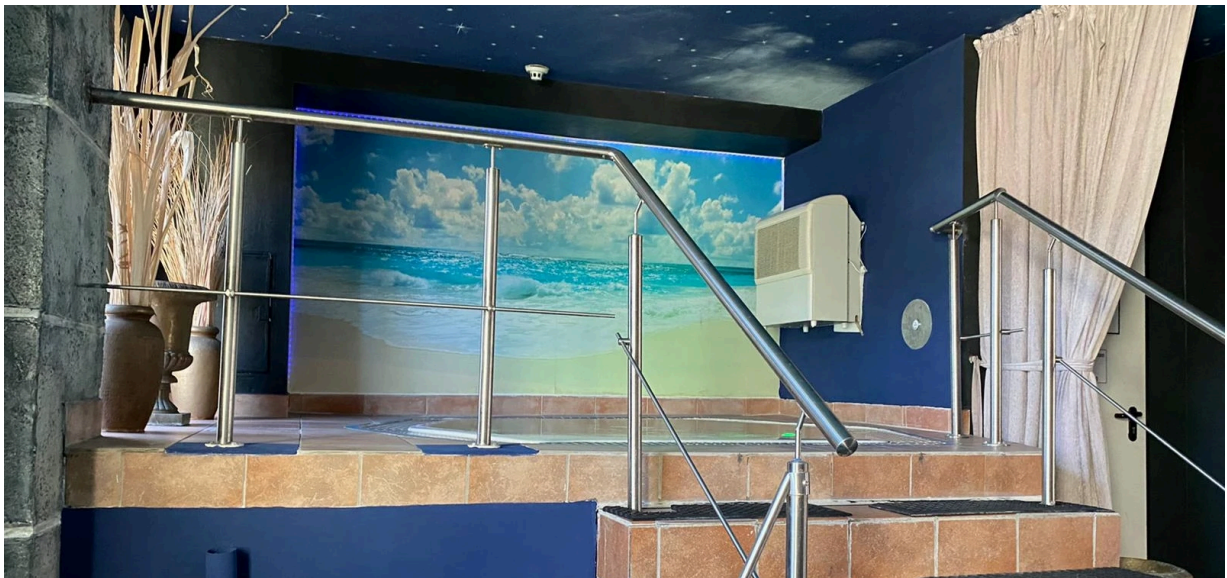
Auch im Parkschloss hat sich der Künstler Henning Feil an einem Motiv versucht und einen Himmel an die Decke gesprüht.