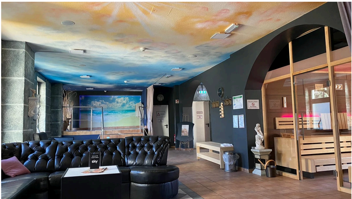
Auch im Parkschloss hat sich der Künstler Henning Feil an einem Motiv versucht und einen Himmel an die Decke gesprüht.