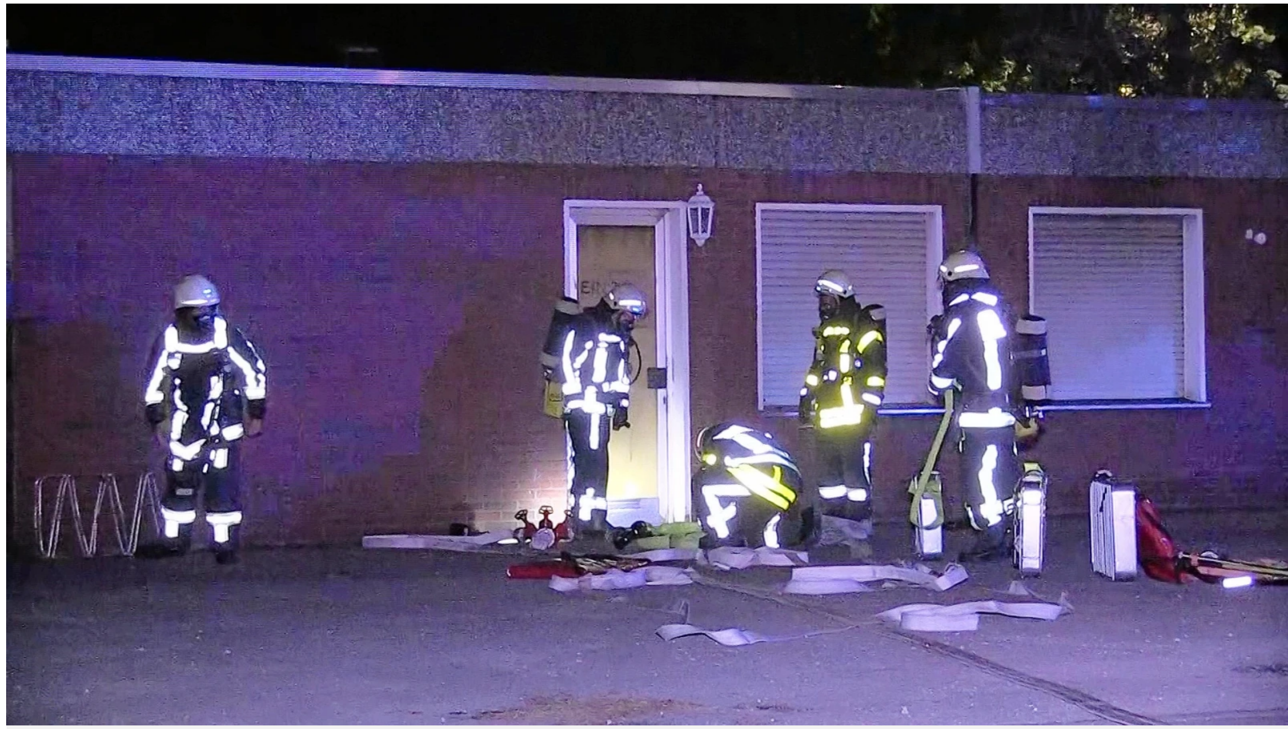
Insgesamt 45 Einsatzkräfte waren vor Ort.