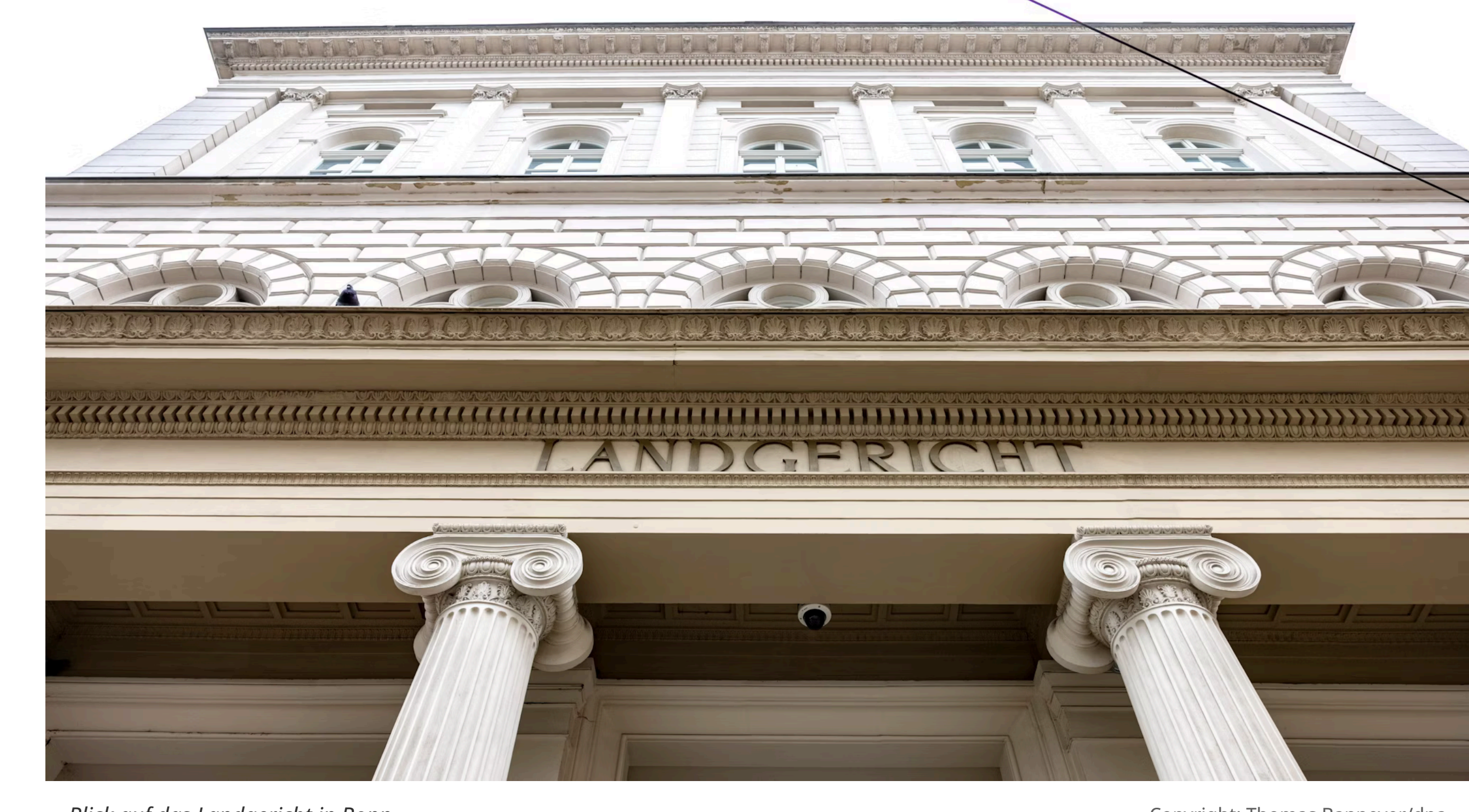
Blick auf das Landgericht in Bonn.

Von Ulrike Schödel 04.07.2024, 17:38 Uhr Lesezeit 3 Minuten