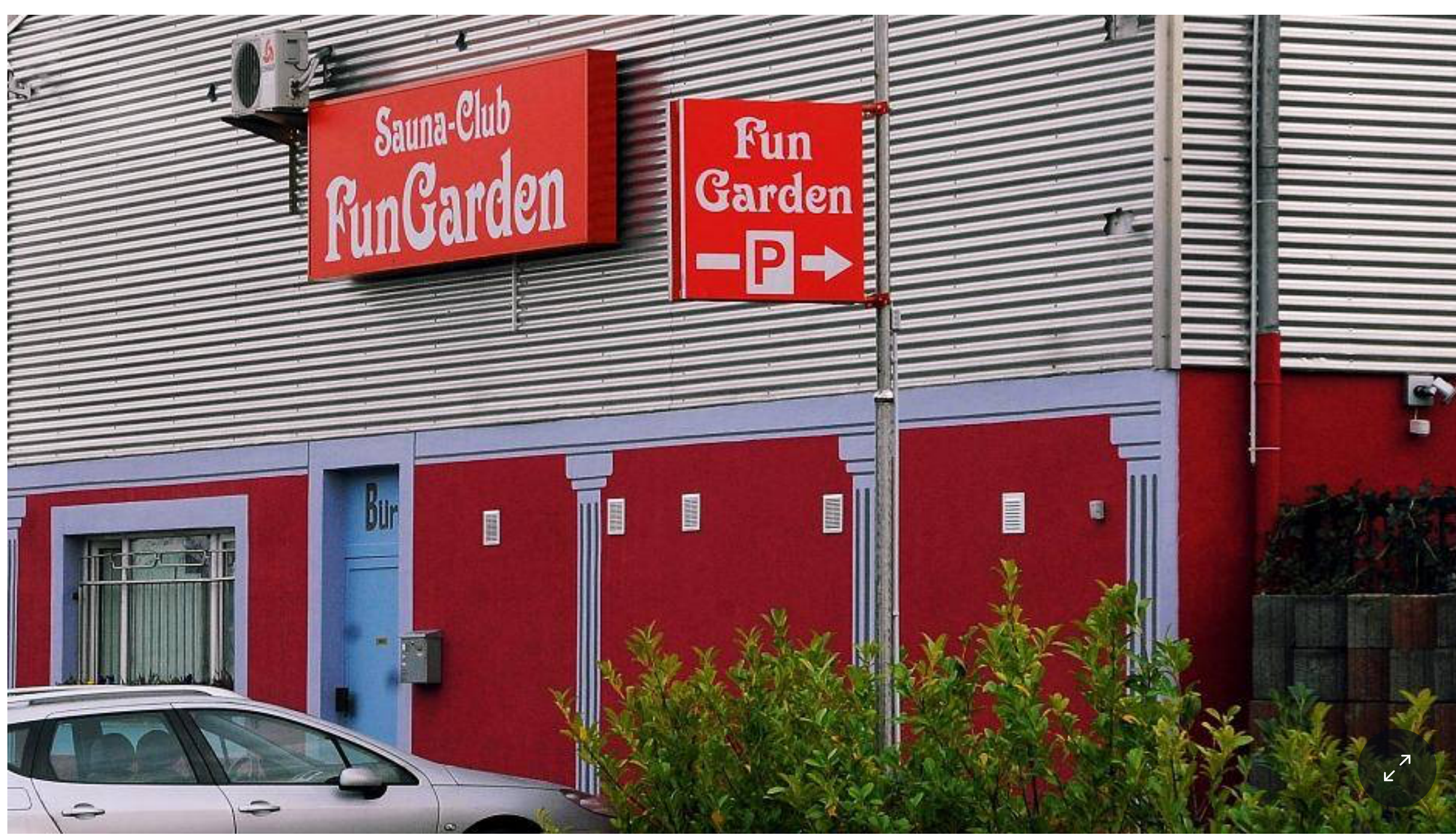
Das "Fun Garden"

Die beiden Bordelle "Fun Garden" und "Villa Auberge" dürften auch im Falle einer Verurteilung des heute angeklagten Betreibers weiter geöffnet bleiben, wenn auch nicht mehr – oder nicht mehr offiziell – unter dessen Leitung.