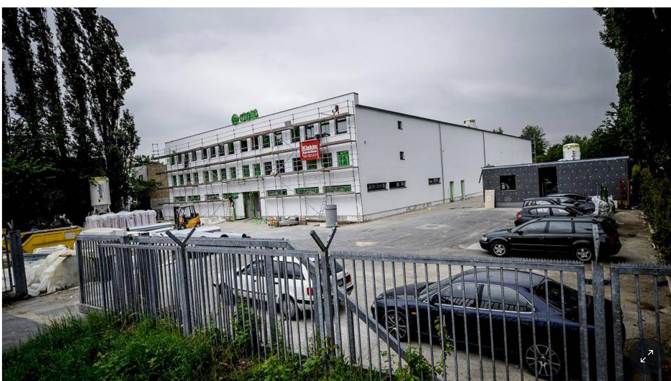
Noch steht an der Oberhausener Straße eine leere Lagerhalle. Im Herbst soll dort aber ein neues Bordell eröffnen.