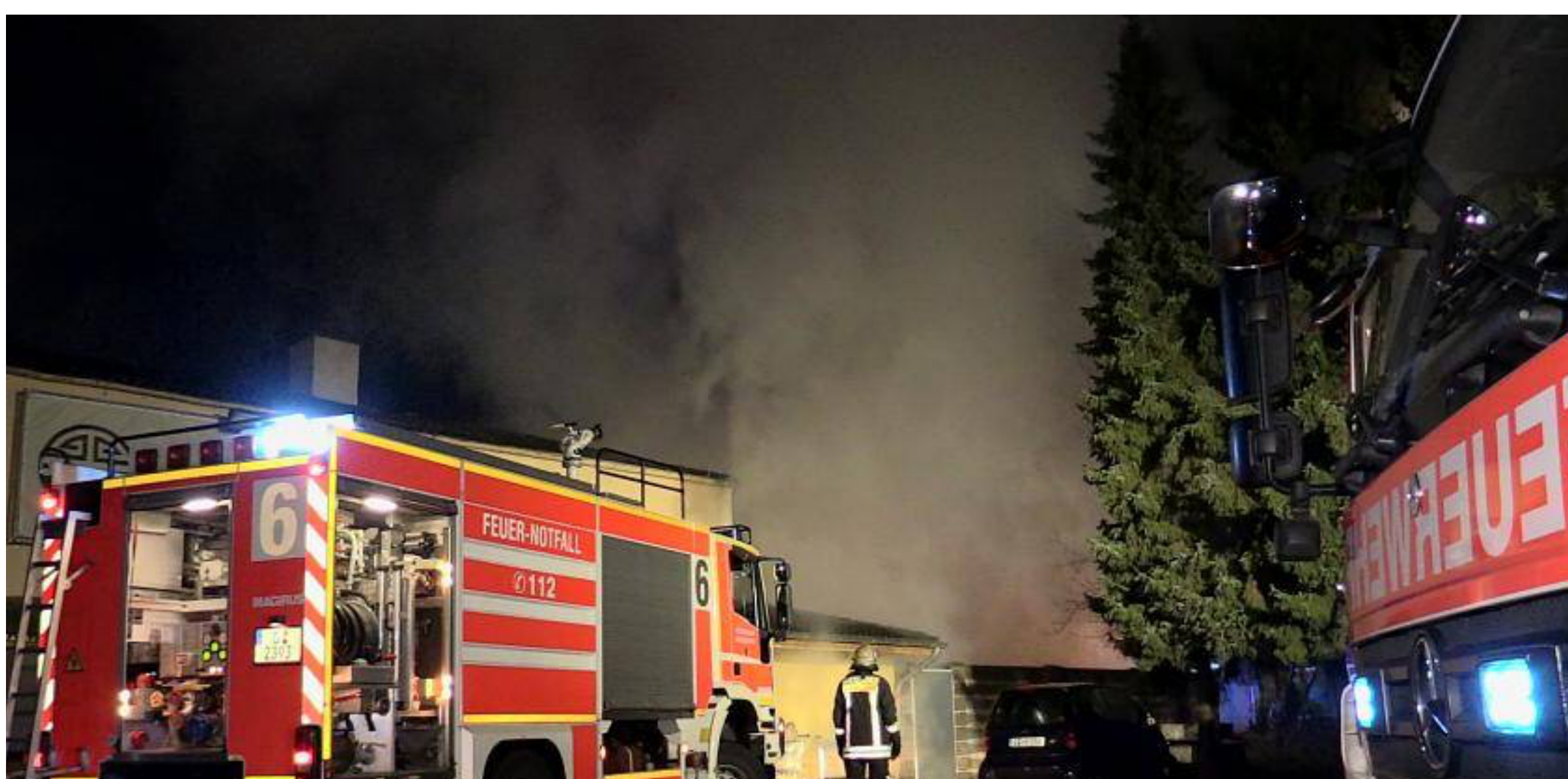
Feuer in Düsseldorfer Saunaclub