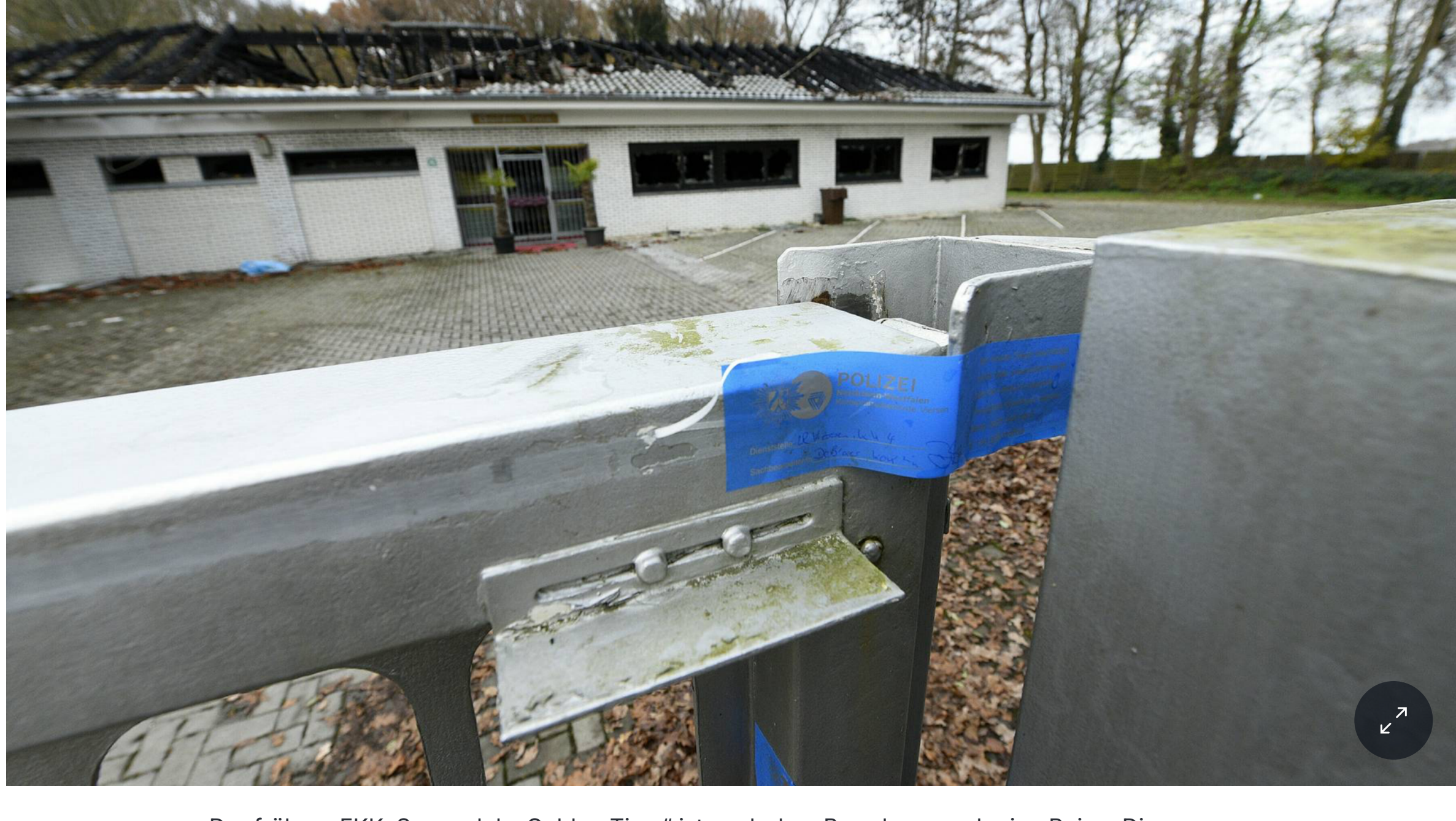
Der frühere FKK-Saunaclub „Golden Time“ ist nach dem Brand nur noch eine Ruine. Die Ermittlungen zur Brandursache laufen.

Nach dem Brand des „Golden Time“, nach eigenen Angaben der größte FKK-Sauna-Club in NRW, scheint es für die Einrichtung am bisherigen Standort in Brügggen-Genholt keine Zukunft mehr zu geben. Auf der Homepage des „Golden Time“ ist angekündigt, dass „wir in Kooperation mit unseren Freunden des Oceans FKK Saunacubs Düsseldorf ab. 1. Dezember unsere Zelte dort aufgeschlagen werden“. Das Angebot aus Brügggen werde täglich bis 23 Uhr in Düsseldorf aufrechterhalten, auch bekanntes Personal, etwa von Empfang oder Theke, werde dort zu finden sein.