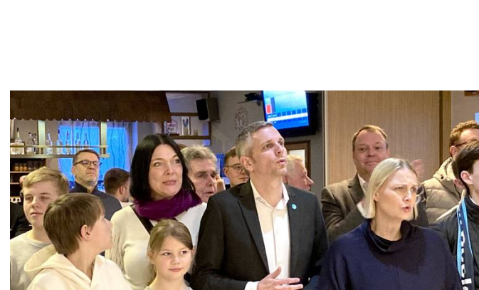
Wahl im Wahlkreis Wesel I

CDU liegt in der Auszählung weiterhin vorne - hohe Wahlbeteiligung bis zum Abend