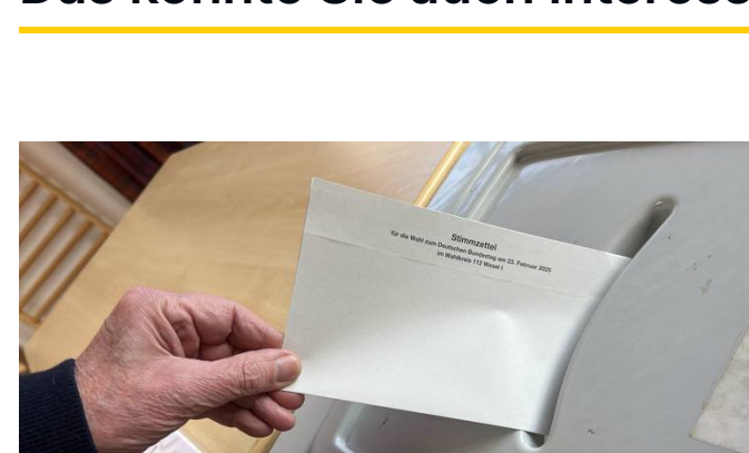
Bundestagswahl in Wesel, Hamminkeln & Schermbeck

CDU liegt in der Auszählung weiterhin vorne - hohe Wahlbeteiligung bis zum Abend