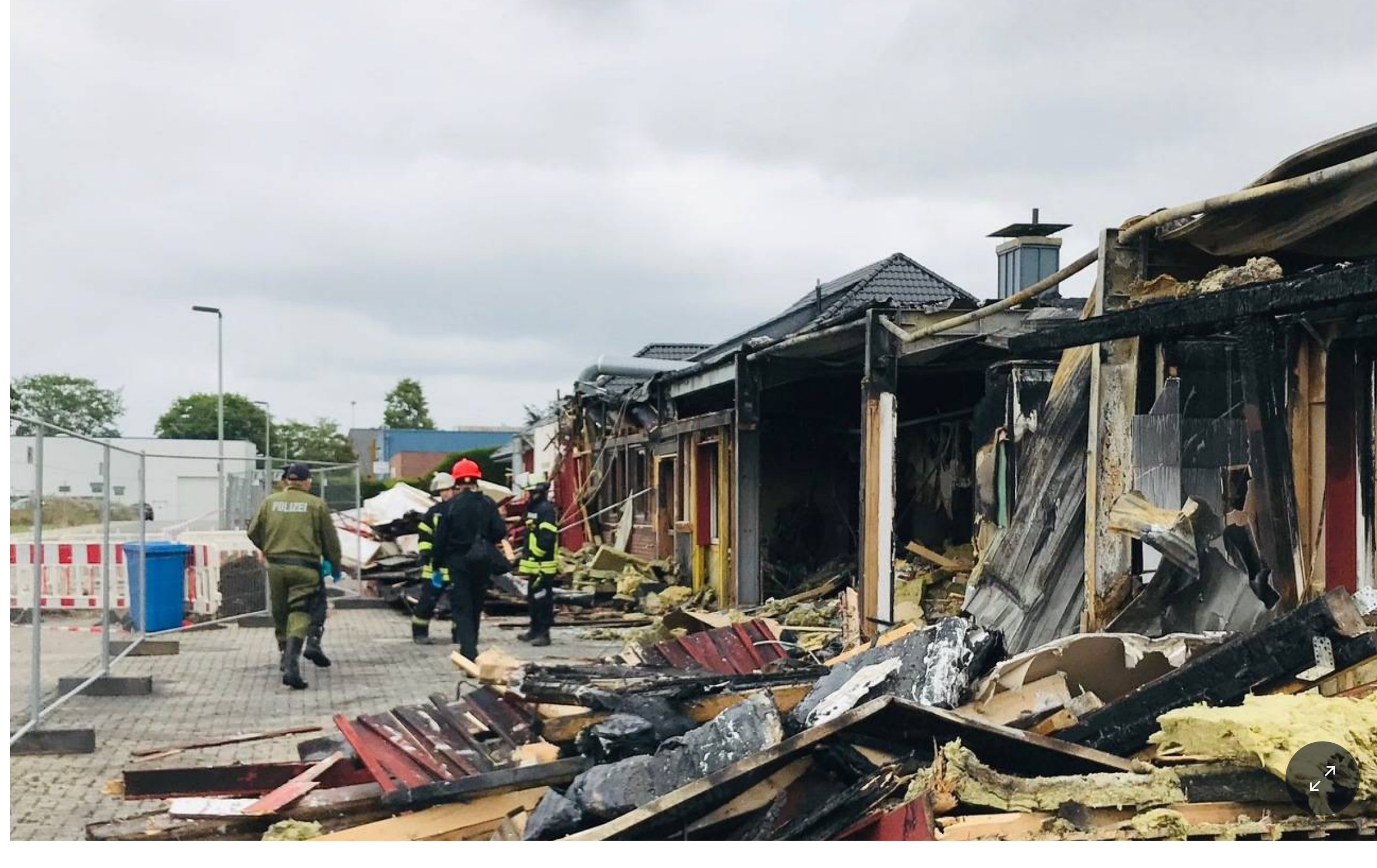
Der abgebrannte Saunaclub Gallardo in Hamminkeln nach der Tat. Inzwischen laufen hier die Aufräumarbeiten. Ein Mann verstarb bei dem Feuer. Was sind die Hintergründe der Tat?

07.08.2019, 19:00 Uhr · 4 Minuten Lesezeit