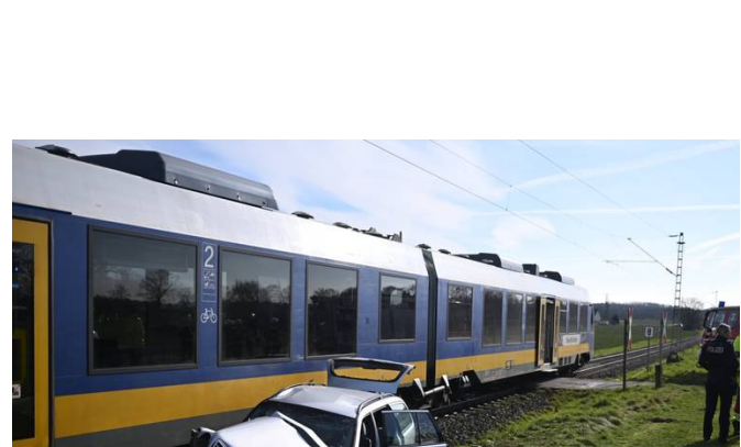
Unfall in Moers - Repelen

Rheinberger stirbt nach Kollision von Zug und Auto