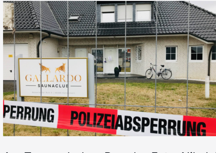
Am Tag nach dem Brand

Hinweise Die Ermittler hoffen weiter auf wichtige Hinweise von Zeugen. Deshalb bittet die Polizei alle Gäste, die von Samstagabend (13. Juli) bis Sonntagnacht (14. Juli) in dem Saunaclub auf dem „Kesseldorfer Rott“ waren, sich beim Duisburger Kriminalkommissariat unter Telefon 0203 280-0 zu melden.