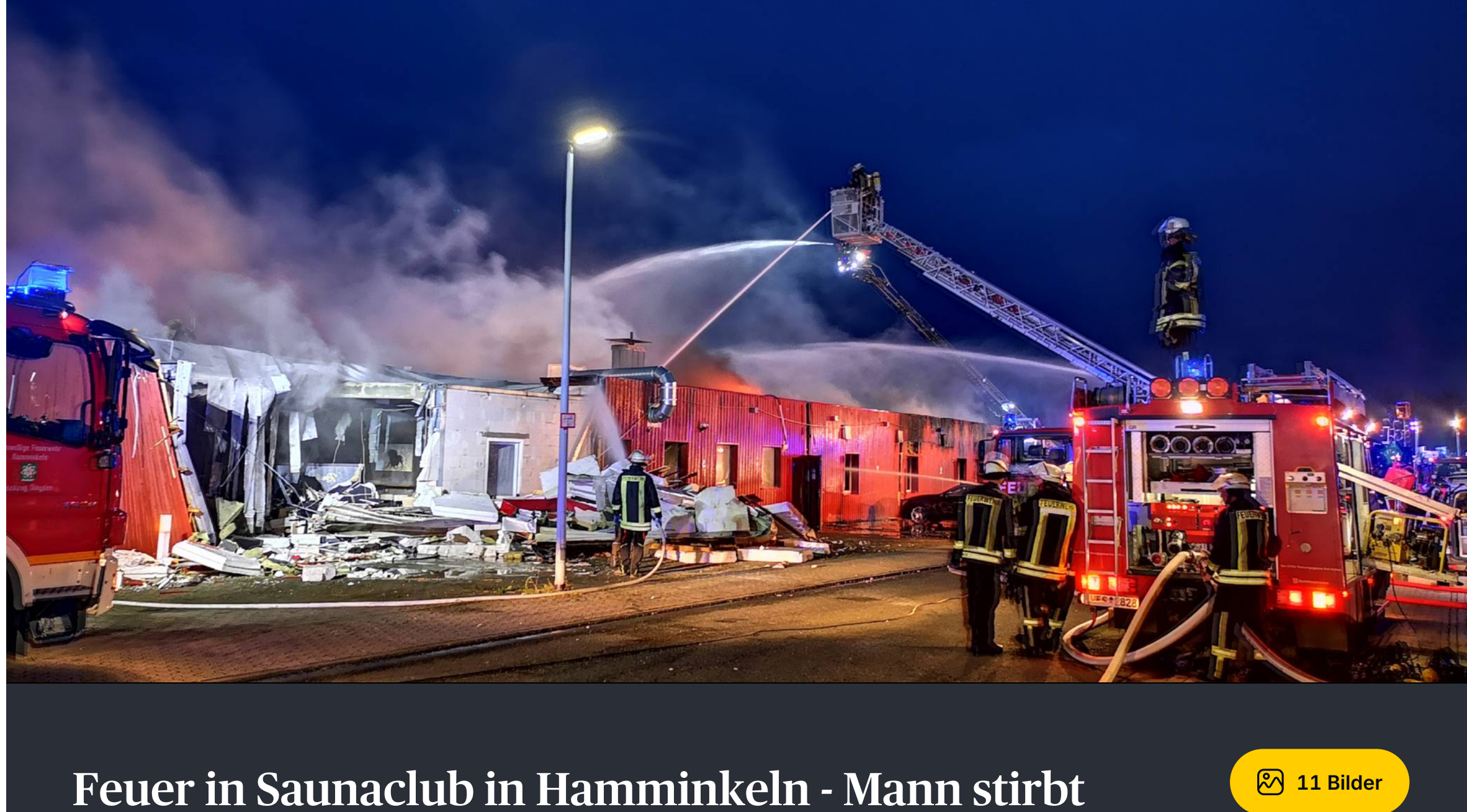
Feuer in Saunaclub in Hamminkeln - Mann stirbt