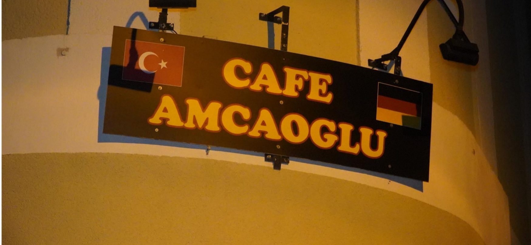
Eine Polizeikontrolle gab es am Freitagabend im türkischen Café Amcaoglu an der Overbergstraße auf Schwerin.