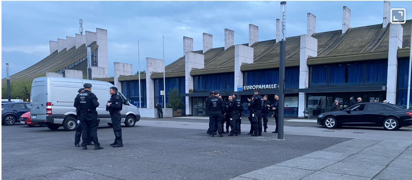
Auf dem Europaplatz in Castrop-Rauxel versammelte sich die Polizei vor den Festnahmen in Folge der Massenschlägerei aus dem vergangenen Jahr und gegen Clankriminalität.

Später wurde bekannt: Eines davon war das türkische Café Amcaoglu mitten im Wohngebiet an der Overbergstraße im Stadtteil Schwerin. Aus diesem Eckcafé wurden nach Angaben der Polizei fünf Spielautomaten aus einem verschlossenen Raum abtransportiert. Das Café wird wohl auch vorerst geschlossen bleiben, war zu hören: Es gebe nur den einen Ein- und Ausgang und damit keinen verpflichtenden zweiten Rettungsweg. An der Overbergstraße gab es noch einen zweiten Einsatzort. Der vierte Schauplatz des Abends in Castrop-Rauxel war nach Polizeiangaben die Lange Straße in Habinghorst.