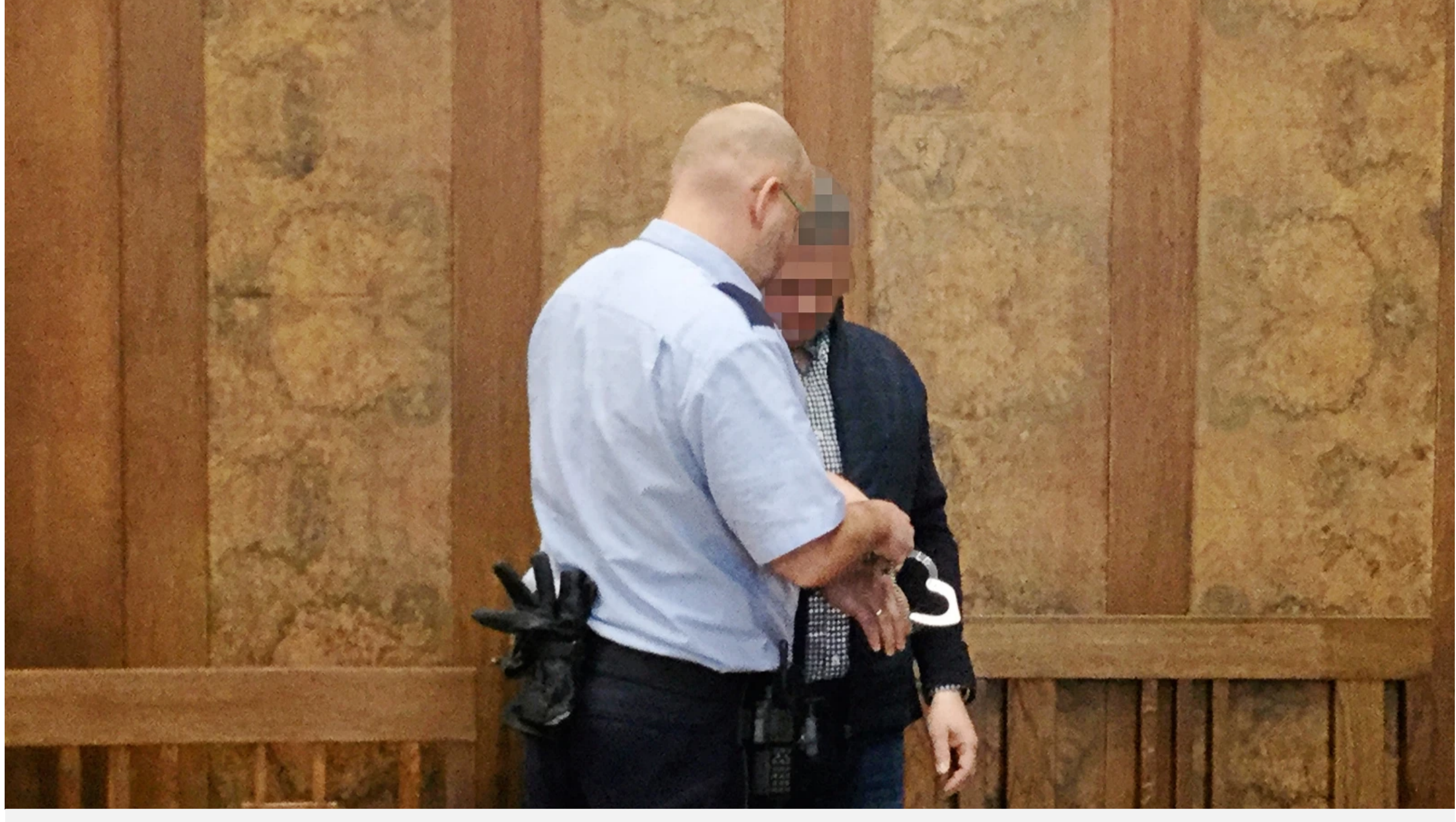
Der 43-jährige Mann aus Voerde ist nach dem Brand in einem Saunaclub in Hamminkeln wegen Mordes angeklagt.

Voerde. Die Anwälte des Angeklagten aus Voerde fordern ein neues Gutachten im Prozess um den Saunabrand. Der 43-Jährige ist wegen Mordes angeklagt.