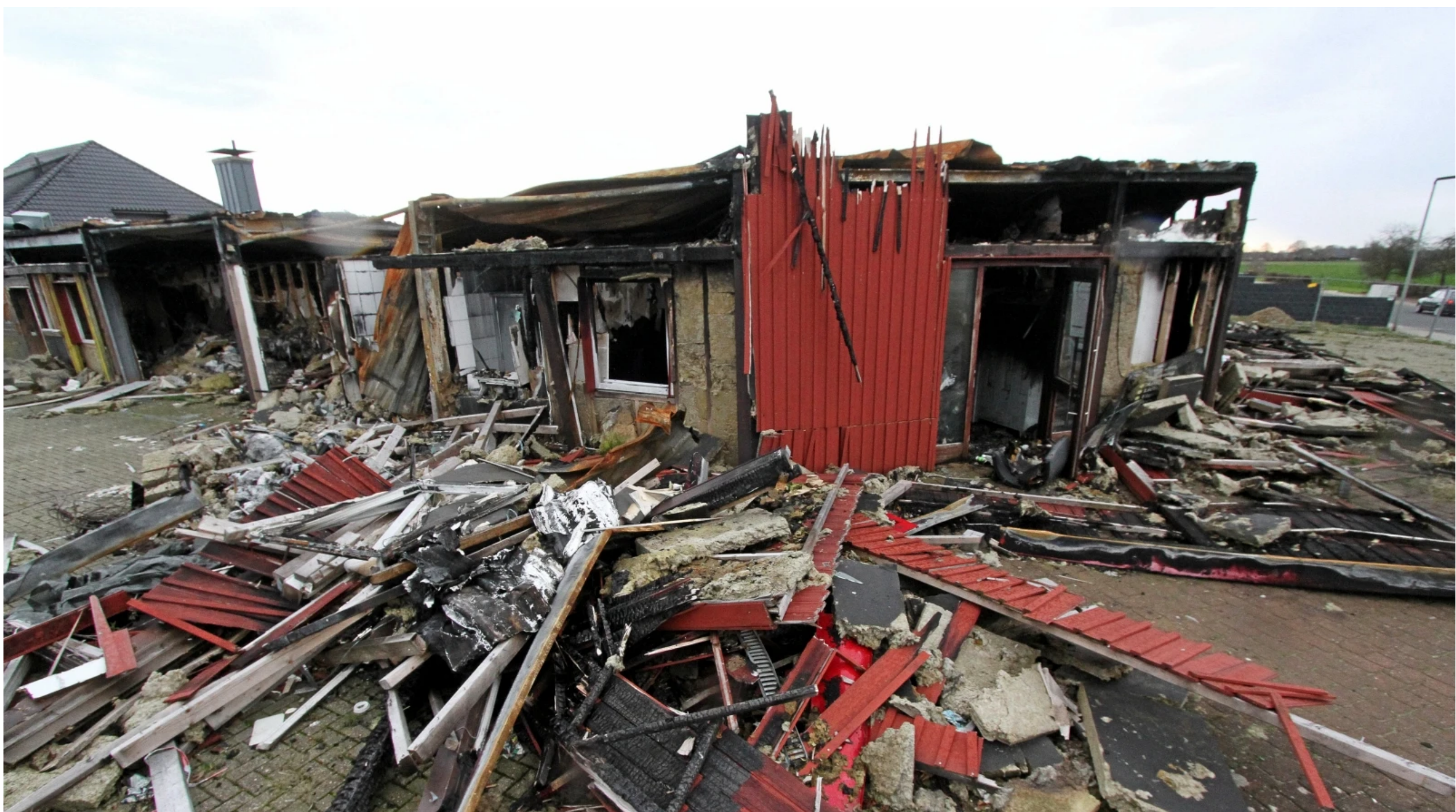
Vom Saunaclub Gallardo ist nur Schutt übrig. Ein Mann starb, weil ein anderer aus Unzufriedenheit zündelte.

Hamminckeln/Duisburg. Ein Gast soll den „Saunaclub“ in Hamminkeln angezündet haben. Ein Gast starb. Gegensätzliche Aussagen des Angeklagten und einer Prostituierten.