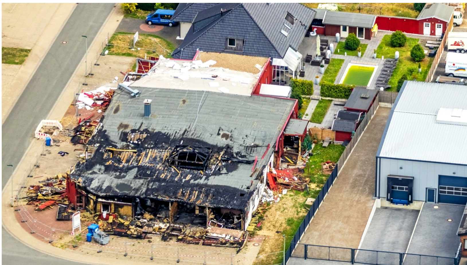
Das Luftbild von Fotograf Hans Blosssey zeigt das Ausmaß des Feuers.

Ohne Zögern soll sich der 43-Jährige, trotz seiner angeblich hochgradigen Alkoholisierung, nacheinander allen drei Frauen gewidmet haben, ohne dass ein Nachlassen seiner Manneskraft erkennbar gewesen wäre. Details, wie die unterschiedlichen Farben der verwendeten Kondome, konnten Zuhörer nur mit einem gewissen Schmunzeln zur Kenntnis nehmen.