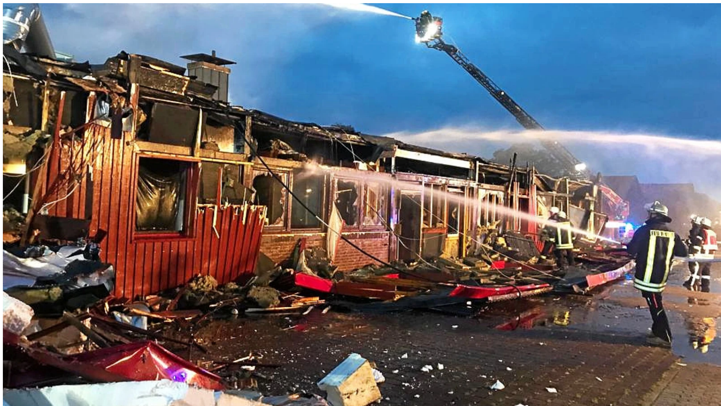
Das Feuer im Saunaclub in Hamminkeln ist vorsätzlich gelegt worden.

16.07.2019, 13:19 Uhr · Lesezeit: 1 Minute