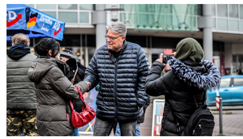
BUNDESTAGSWAHL IN ESSEN

➤ Bundestagswahl in Essen: AfD Essen. Insgesamt konnte die Partei in Essen ihr Zweitstimmenergebnis auf gut 17 Prozent mehr als verdoppeln. AfD sieht das Migrationsthema als Hauptgrund. Von Frank Stenglein