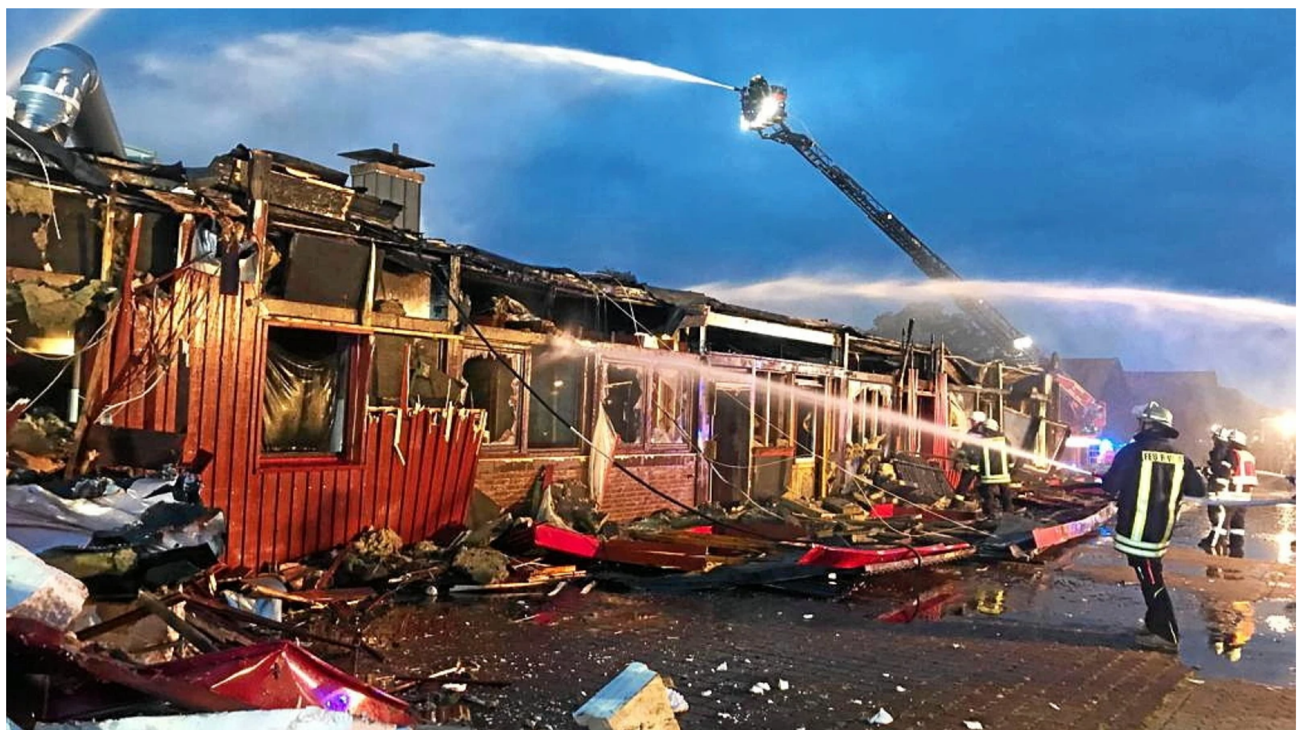
150 Einsatzkräfte waren im Juli 2019 vor Ort, um den Brand im Hamminkelner Saunaclub zu löschen. Ein Mann starb in den Flammen.

15.08.2023, 16:00 Uhr • Lesezeit: 1 Minute