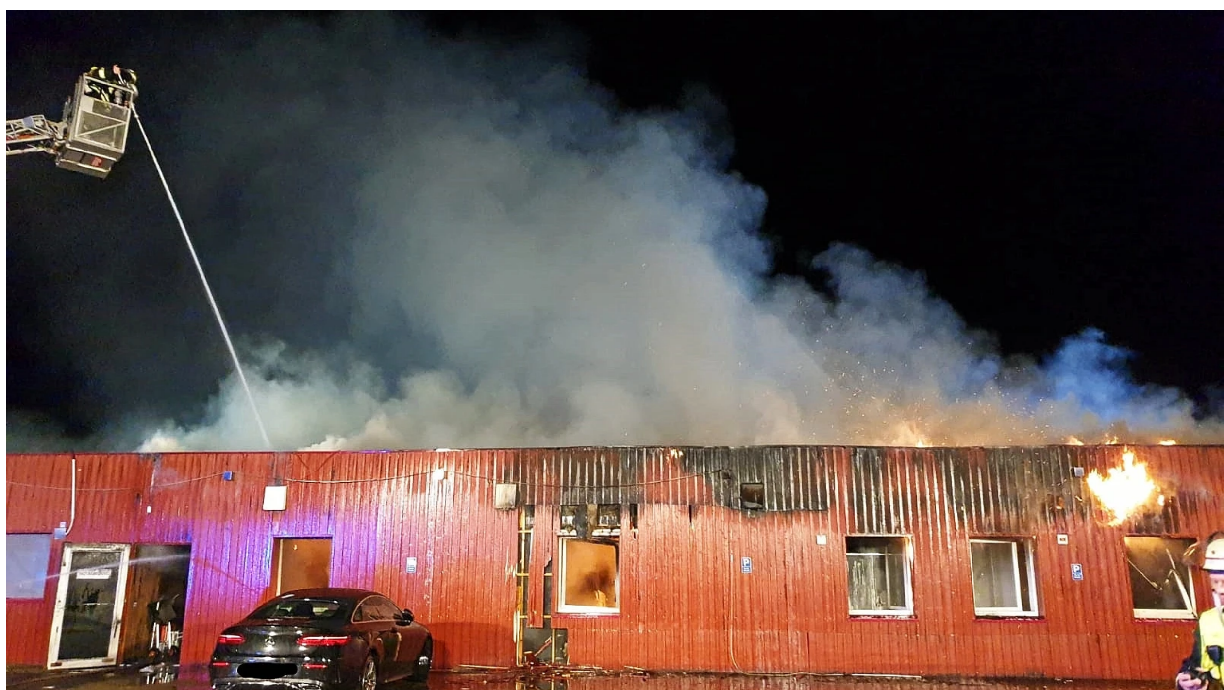
Der Prozessauftakt um einen tödlichen Brand in einem Saunaclub in Hamminkeln wurde verschoben.

Hamminkeln/Duisburg. Der Prozess gegen einen Voerder, der in Hamminkeln ein Feuer gelegt haben soll, wird am 27. Januar eröffnet. Grund: Ein Gutachten kam zu spät.