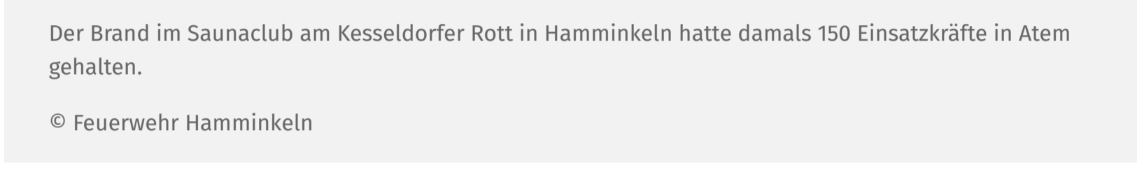
Der Brand im Saunaclub am Kesseldorfer Rott in Hamminkeln hatte damals 150 Einsatzkräfte in Atem gehalten.

Es ist still geworden um den abgebrannten Saunaclub „Gallardo“ am Kesseldorfer Rott im Hamminkeler Gewerbegebiet. Der Anbau ist bis auf die Betonplatte am Boden geräumt, das weiß geklinkerte Haupthaus mit seinen zwei Garagen sähe von der Straßenseite ganz intakt aus, wären da nicht die Bauzäune und die herunter gelassenen Rollläden an den Fenstern. Lediglich an der Seite sieht man die „angeknabberte“ Dachkante. Sie erinnert an die Brandnacht am 14. Juni 2019, die einen Menschen das Leben gekostet hat. Der Brandstifter war danach zu sechs Jahren Haft verurteilt worden.