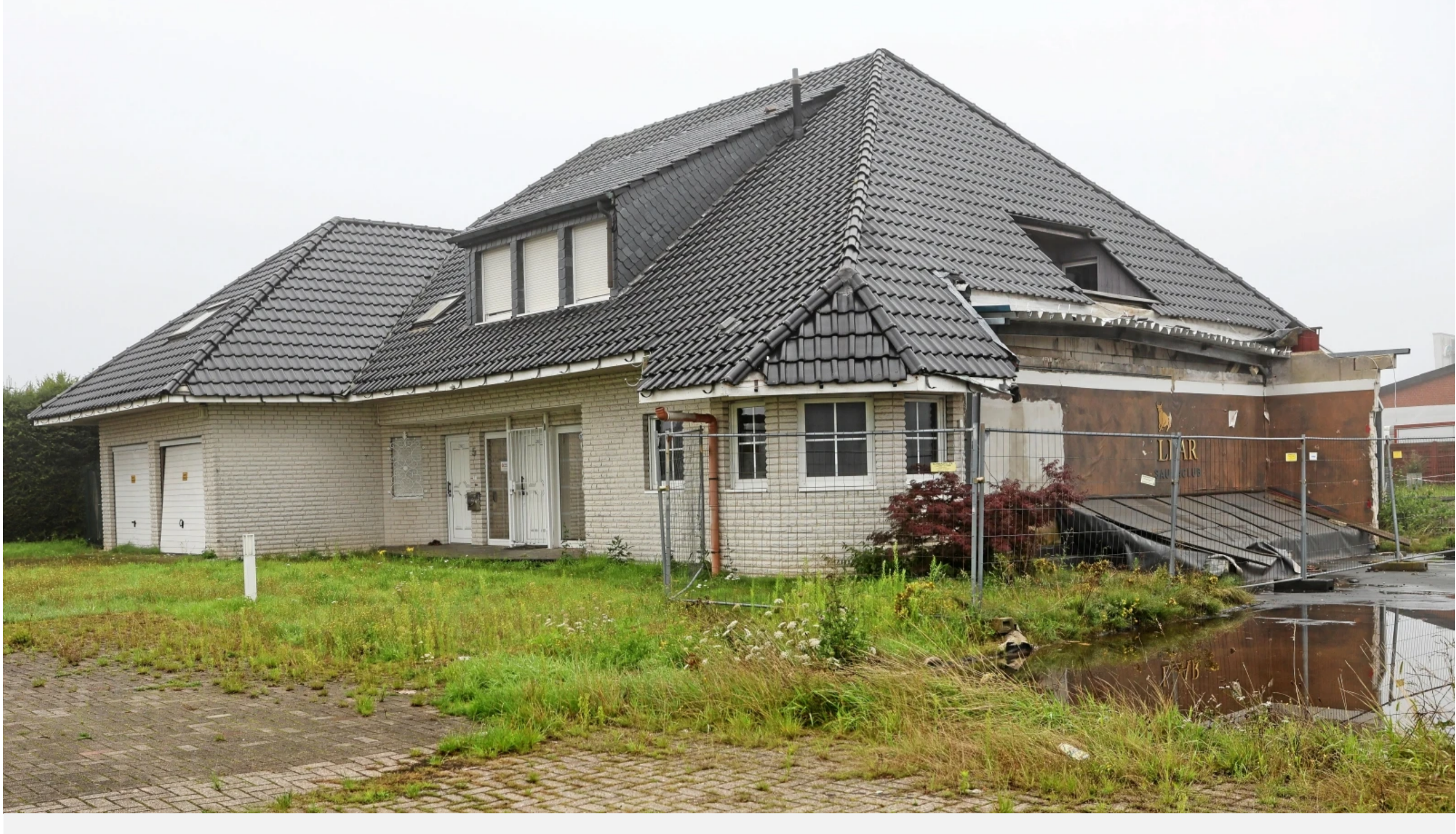
Was wird aus dem Hamminkeler Saunaclub „Gallardo“? Bisher sind keine neuen Pläne öffentlich.