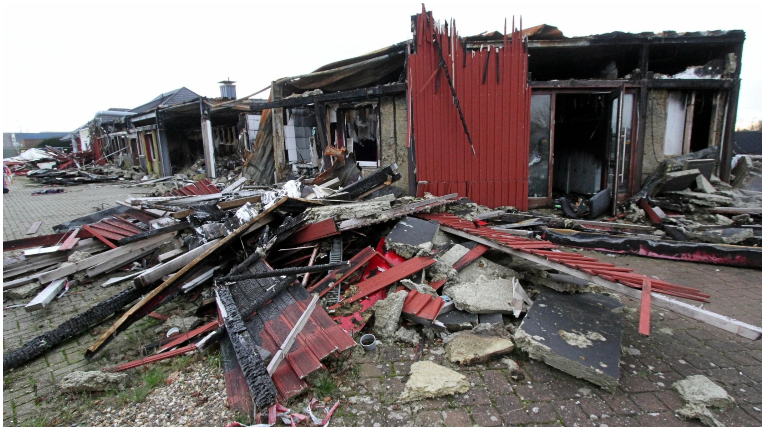
Die Brandruine des Saunaclubs in Hamminkeln.