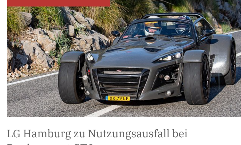
LG Hamburg zu Nutzungsausfall bei Donkervort zu Nutzung

Steht einem Arbeiter Emissionsersatz zu, weil sein Auto unter Emissionen aus dem Betrieb seines Arbeitgebers gelitten hat? Ein BAG-Urteil aus dem Jahr 1965 steht am Ende einer Epoche, in der die Schlotte noch äußerst kräftig rauchen durften.