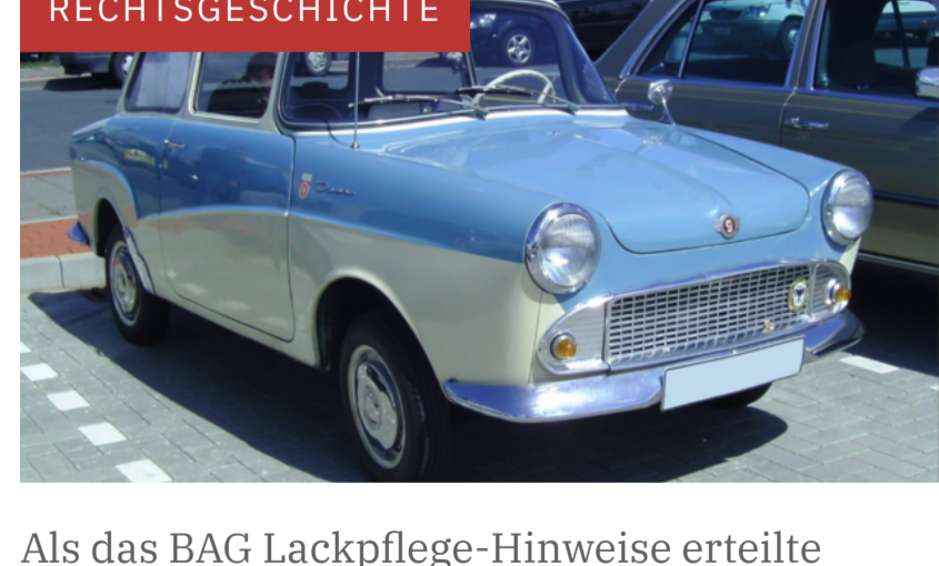
Als das BAG Lackpflege-Hinweise erteilte

Auch die Messerangreiferin von Hamburg kommt nicht in Untersuchungshaft, sondern wird in der Psychiatrie untergebracht. Wie im Fall von Aschaffenburg deutet sich hier ein Sicherungsverfahren statt einer Anklage an.