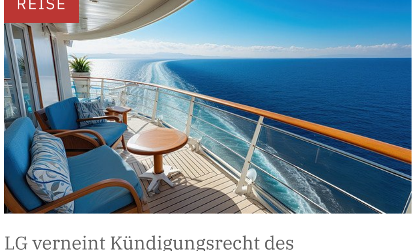
LG verneint Kündigungsrecht des Reiseveranstalters