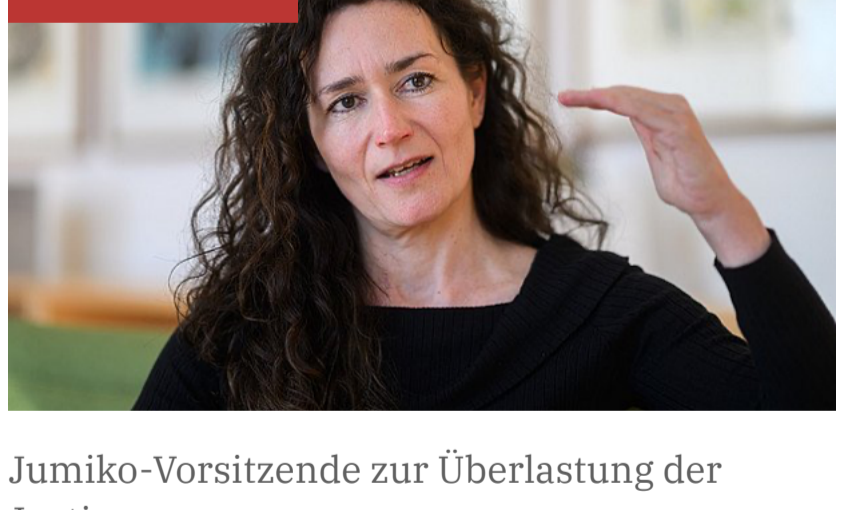
Justiz-Vorsitzende zur Überlastung der Justiz