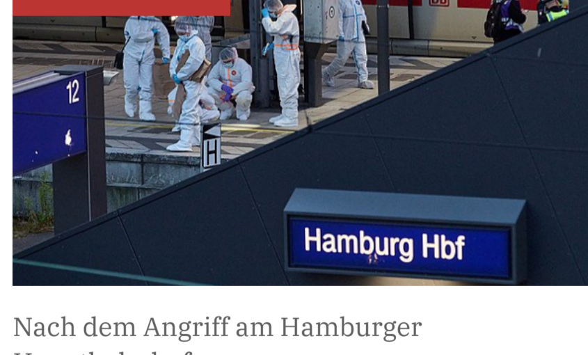
Nach dem Antritt am Hamburger Hauptbahnhof

Auch die Messerangreiferin von Hamburg kommt nicht in Untersuchungshaft, sondern wird in der Psychiatrie untergebracht. Wie im Fall von Aschaffenburg deutet sich hier ein Sicherungsverfahren statt einer Anklage an.