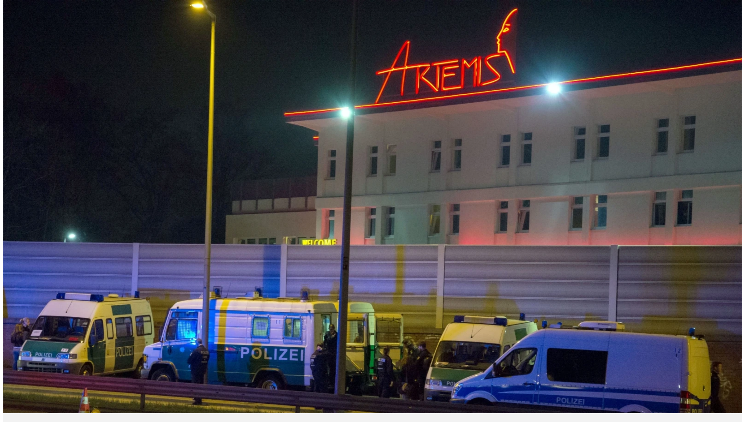
Am 13. April 2016 führen Polizei und Zoll eine Großrazzia im Nobelbordell "Artemis" durch.

Von Dennis Meischen und Andreas Gandziar