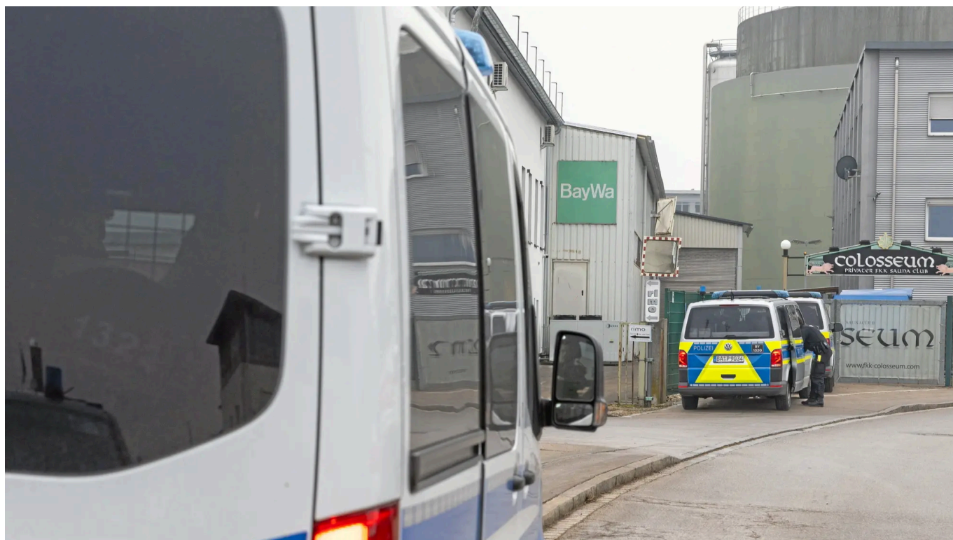
Polizeiautos parkten bei der Razzia im Colosseum im Gewerbegebiet beim Gaskessel Oberhausen. Zwei Verdächtige kamen in U-Haft.

Wenn die Polizei in ein Bordell einmarschiert und den Laden einmal auf den Kopf stellt , geht es vielfach um schwerste Kriminalität im Milieu. Um Menschenhandel, Zwangsprostitution, um Gewalt und Ausbeutung. Als die Beamten der Augsburger Kripo vor wenigen Wochen mit einem Beschluss das „Colosseum“ in der Nähe des Gaswerks in Oberhausen durchsuchten , hofften sie allerdings, Beweise für Straftaten im Bereich der Wirtschaftskriminalität zu finden . Das Verfahren dreht sich um dubiose Deals mit Edelmetallen und Kupfer; auch ein weiterer Verdächtiger ist in den Fokus der Ermittler geraten.