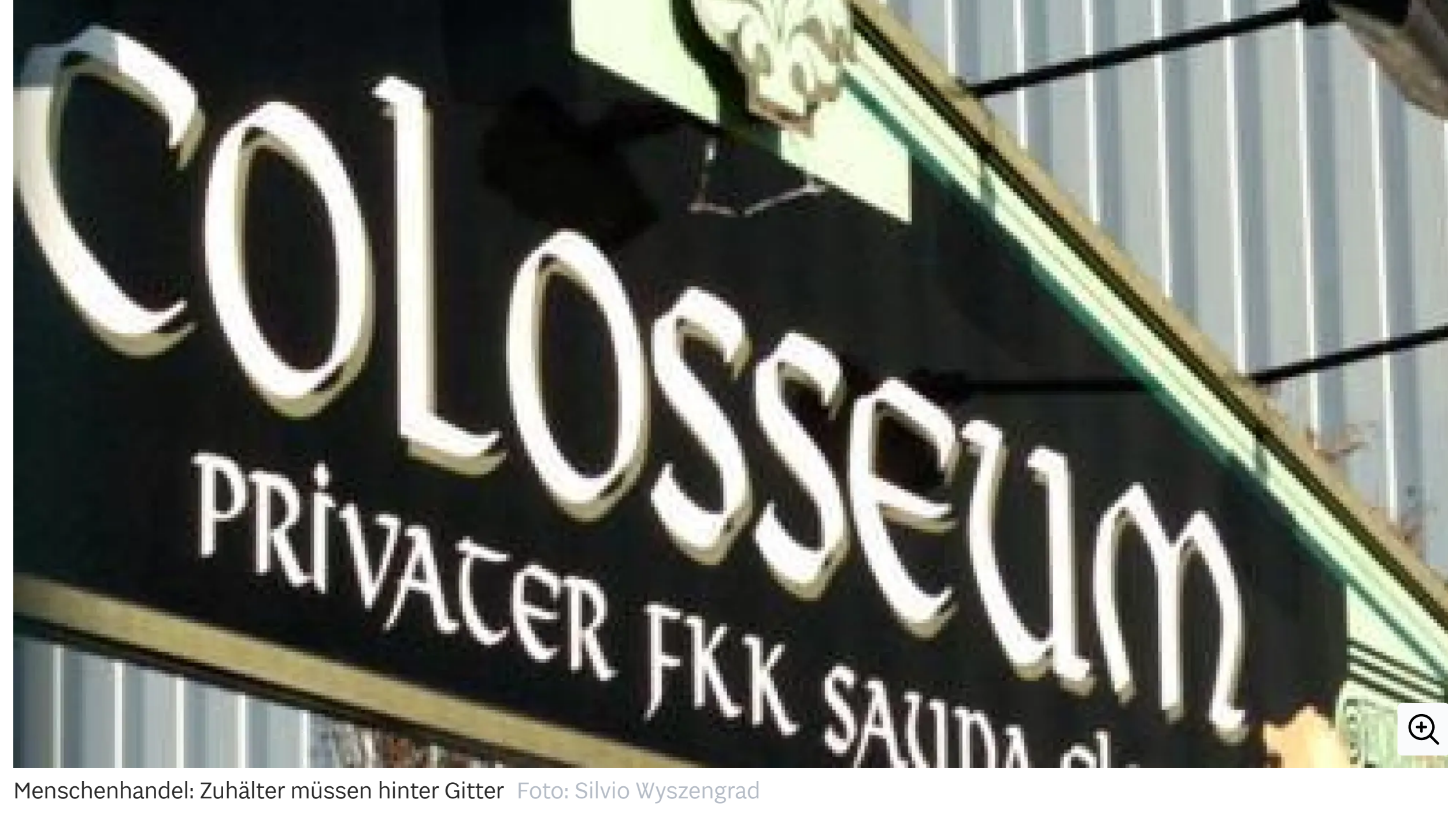
Menschenhandel: Zuhälter müssen hinter Gitter